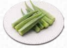
Lady's Finger オクラ $5