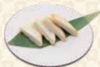
Fish Cake Original さつまあげ $5