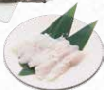
White Fish Fillet 白身魚 $8