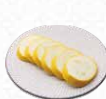
Yellow Zucchini 黄ズッキーニ $5