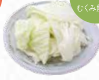
Cabbage キャベツ $5