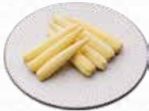
Baby Corn ベビーコーン $5