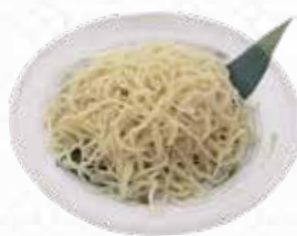
Beauty Noodle 健美麺 $4