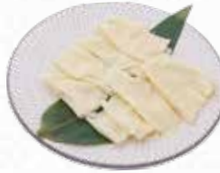
Tofu Skin ゆば $10