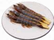
Prawn 海老 $6