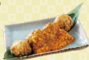
Shiitake Nanban Spicy しいたけ南蛮 スパイスー $9.5