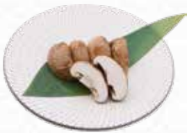
Shitake Mushroom 椎茸 $4