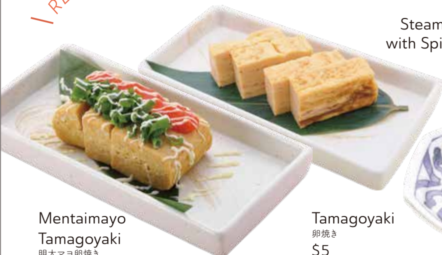
Mentaimayo Tamagoyaki 明太マヨ卵焼き $7