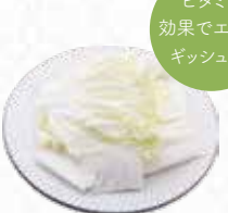
Chinese Cabbage 白菜 $4