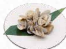
Venus Clam あさり $6