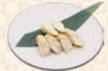
Fish Cake Cheese チーズさつまあげ $5