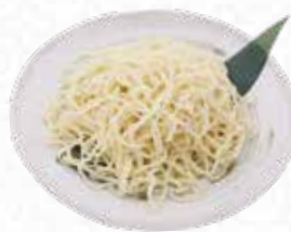
Thick Mochi-Mochi Noodle もちもち太麺 $4