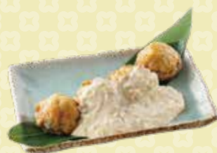
Shiitake Nanban Original しいたけ南蛮 オリジナル $9