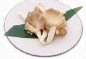
Oyster Mushroom 平茸 $5