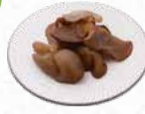
Fresh Black Fungus 生さくらげ $5