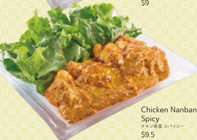
Chicken Nanban Spicy チキン南蛮 スパイスー $9.5