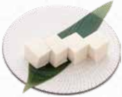
Silken Tofu 絹豆腐 $4