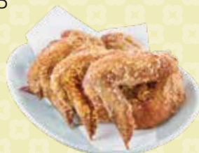
Deep Fried Chicken Wings 手羽唐 $8