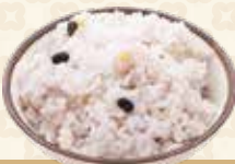
Sixteen-Grain Rice 十六穀米 $3

ミネラル、ビタミンB 類、食物繊維などが白米の約2 倍。多彩な栄養が詰まっています。