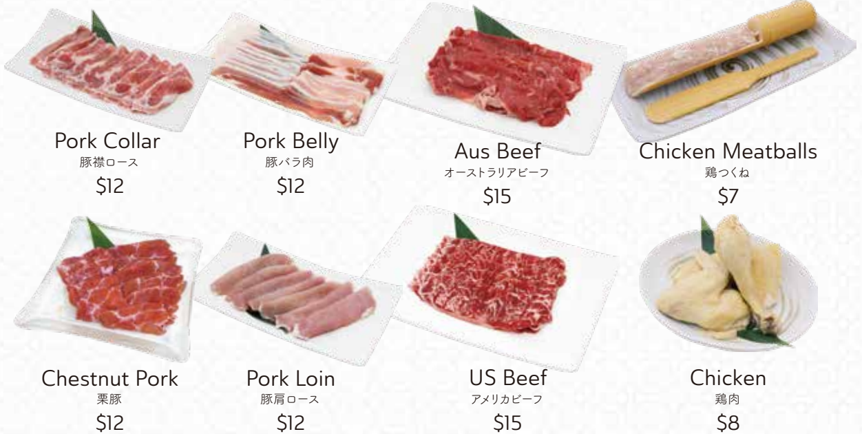
Pork Collar 豚襟ロース $12