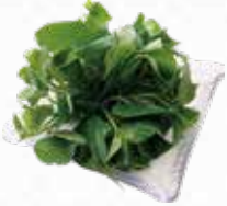
Baby Sweet Potato Leaves さつまいもの若葉 $5