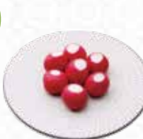
Red Radish ラディッシュ $5