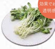
Sunflower Sprout 向日葵のスプラウト $5