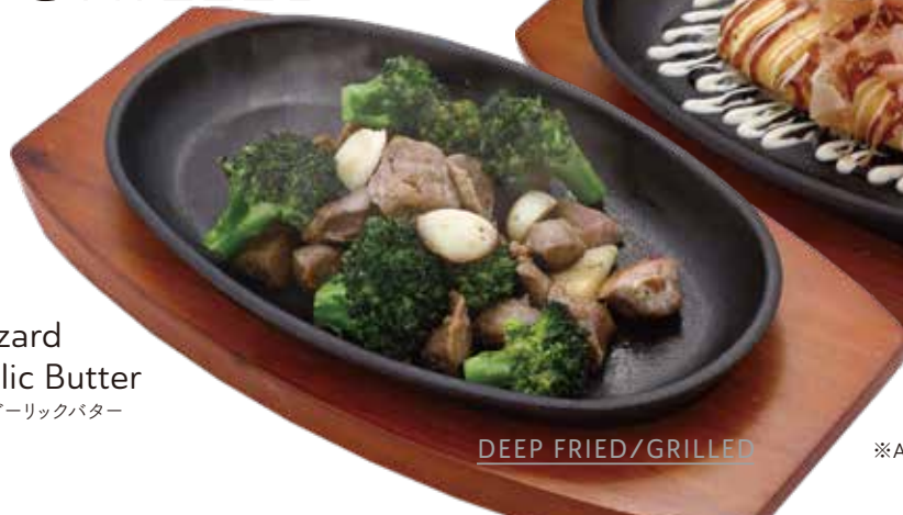
Gizzard Garlic Butter 砂肝ガーリックバター $10