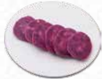
Purple Sweet Potato 紫芋 $5