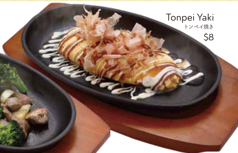
Tonpei Yaki トンペイ焼き $8