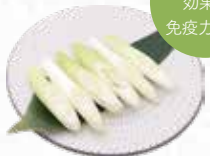
Japanese Leek 長ネギ $4