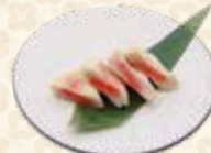
Fish Cake Mentaiko 明太子さつまあげ $5