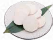
Yam ヤマイモ $5