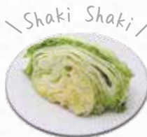
Lettuce レタス $4