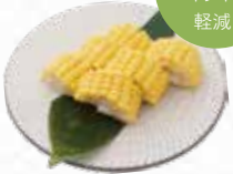
Sweet Corn とうもろこし $5