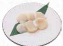
Scallop 帆立貝 $18