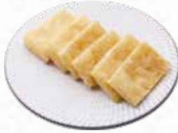
Deep Fried Tofu 油揚げ $4