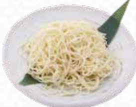
Thin Tsuru-Tsuru Noodle つるつる細麺 $4