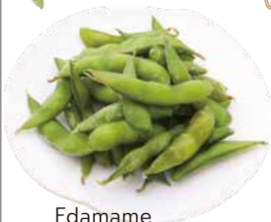
Edamame 枝豆 $5