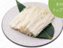
Enoki Mushroom エノキ茸 $4