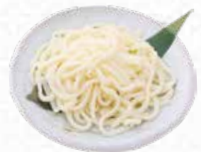
Udon Noodle うどん $5