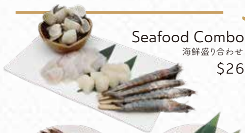
Seafood Combo 海鮮盛り合わせ $26