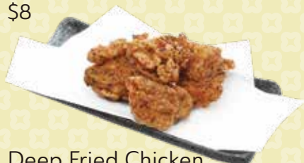
Deep Fried Chicken 鶏の塩唐揚げ $8