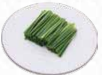
Chinese Chives ニラ $4