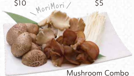
Mushroom Combo きのこの盛り合わせ $15